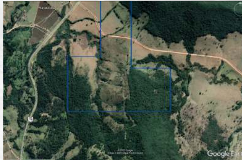
PROCESSO ANM 832.314/2018

PORTFOLIO - PROCESSO TÉCNICO ANM No 832.314/2018