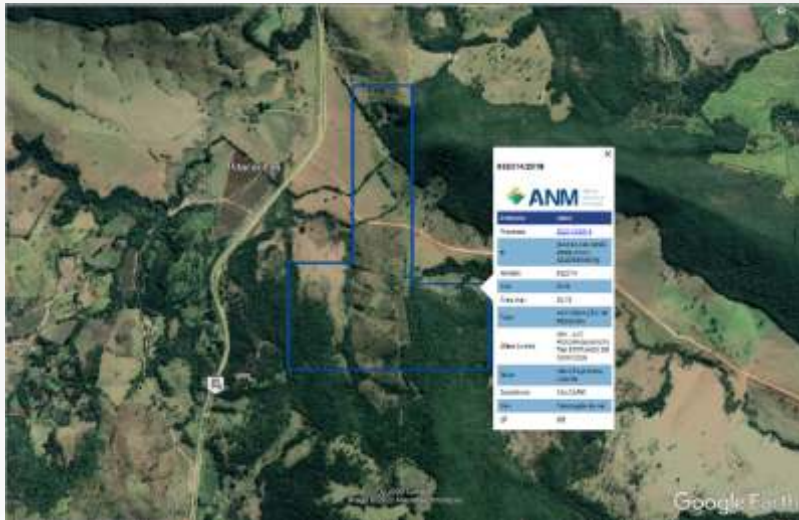
PROCESSO ANM 832.314/2018